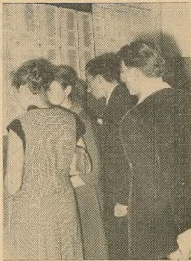
Апошнія хваляванні. Кожны прагна шукае сябе ў спісу па-ступіўшых ва ўніверсітэт.